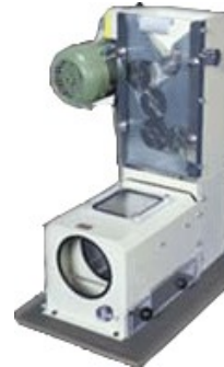
Брояч на семена