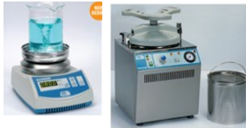
Бъркалки и шейкъри, Автоклави, стерилизатори