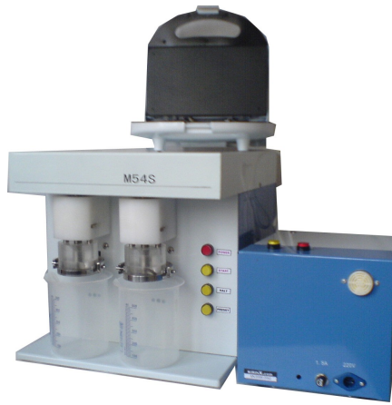
Глуеномиячка за определяне на глютен, глюенов индекс и сух глютен