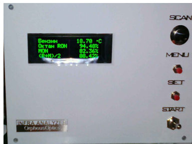
Експресен анализатор на горива Fuel Analyzer – Octane / Cetane