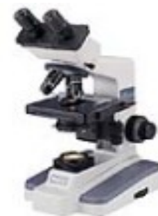
Микроскопи и лупи