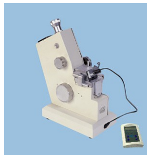
АВВЕ – рефрактометри и поляриметри