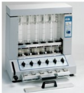
Сокслет апарат, анализ на фибри