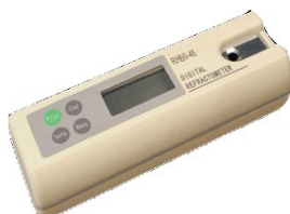
Цифрови рефрактометри за мед, захари по Brix, сухо вещество, солени р-ри, антифриз