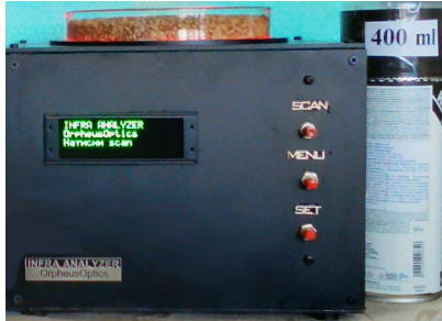
Експресен анализатор на цяло зърно - Infra Analyzer