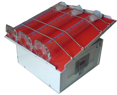
Тест за седиментация