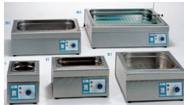
Водни и пясъчни вани, мантели