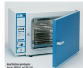
Муфелни пещи и термостати

Психрометри, газови анализатори, шумомери, вибрации, фреони, тахометри, манометри, скорост на поток, температура, налягане, анемометри, фото и радиометри, луксометри, барометри