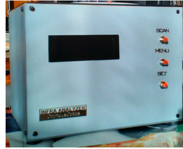
Експресен анализатор за растителни масла