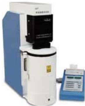
Падащо число – FN