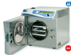
Инкубатори, сушилни, фризери